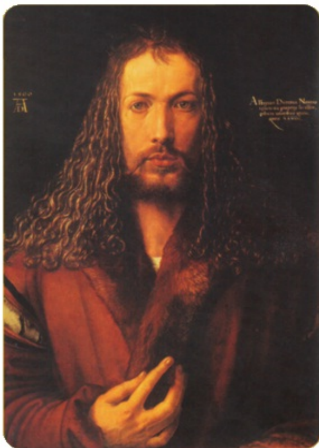
Албрехт Дирер: Аутопортрет

ЧАСОПИС ЗА ПОЛИТИЧКУ КУЛТУРУ И КУЛТУРНУ ПОЛИТИКУ